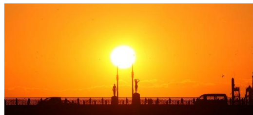
釧路市の夕日は世界三大夕日のひとつ