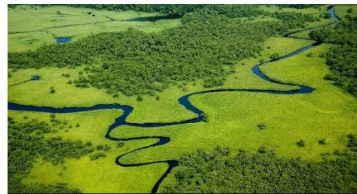
日本最大の湿原である「釧路湿原国立公園」